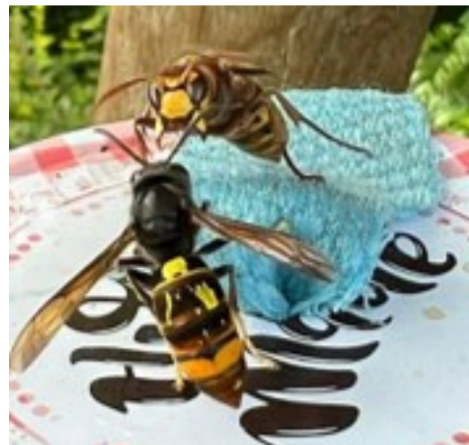
Op de voorgrond zie je een Aziatische hoornaar. De ander is een Europese. Beiden zijn op de wiekpot afgekomen. Ze drinken door de sappen uit het doekje te zuigen.