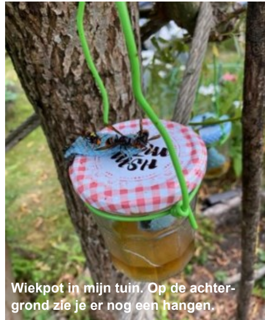
Wiekpot in mijn tuin. Op de achtergrond zie je er nog een hangen.